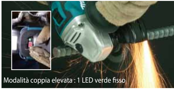
Modalità coppia elevata : 1 LED verde fisso

Per garantire la massima qualità del lavoro, la scheda elettronica varia velocità e conseguente coppia in base alla lavorazione eseguita.